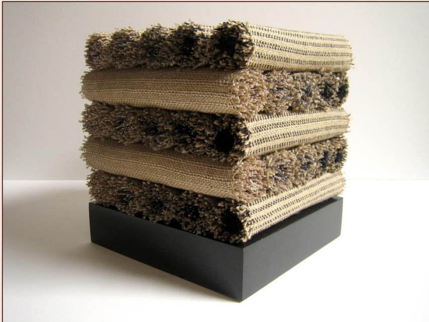
hoek met beige-zwarte kopse kanten voor