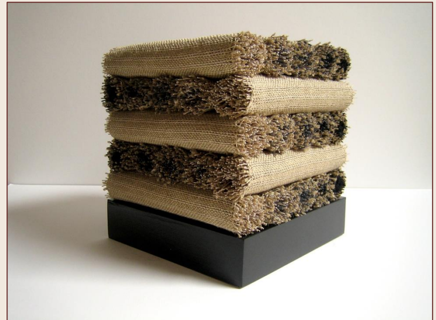
hoek met beige-beige kopse kanten voor