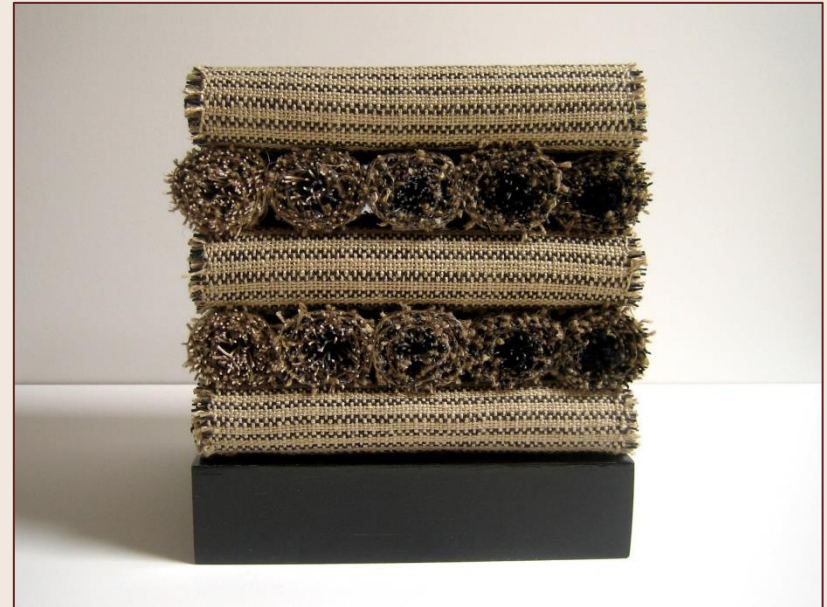
zijkant met zwart-zwart weefselzijde van de rollen