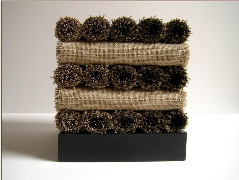
zijkant met beige-beige weefselzijde van de rollen